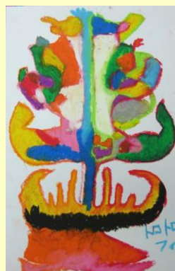
パスで「自分へのごほうびトロフィー」