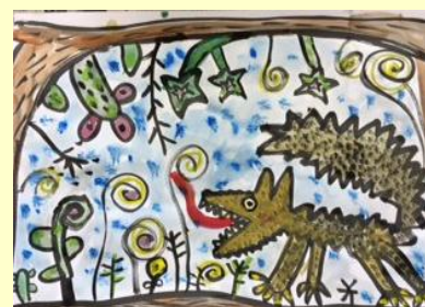
お話の絵「オオカミのともだち」