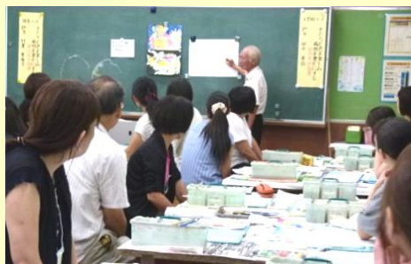
実技研修のようす

大阪児童美術研究会では、参加された方々から大好評をいただいている実技研修「絵や工作などの造形指導セミナー」を、内容も新たに下記の通り開催します。