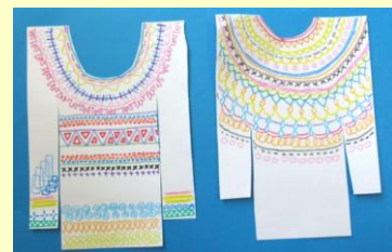
線の模様あそび「おしゃれなセーター」