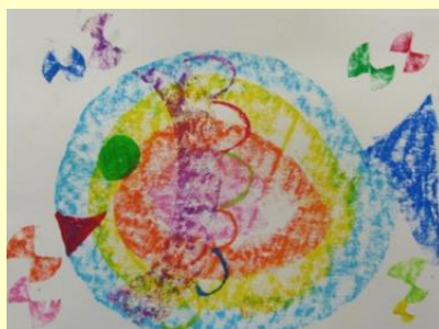
パスを横に倒して描いた「にじいろのさかな」