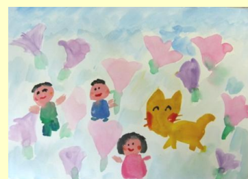
お話の絵「こぎつねきっこは、何してる？」

※ 掲載写真は、平成 28 年度「絵や工作などの造形指導セミナー」を受講された方の作品等です。