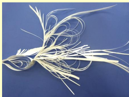
紙表現「おしゃれな鳥」