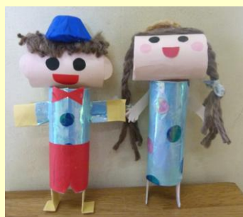
トイレットペーパーの芯でつくる人形