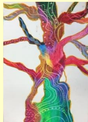
パスの塗りこみ・スクラッチで「大きな木」